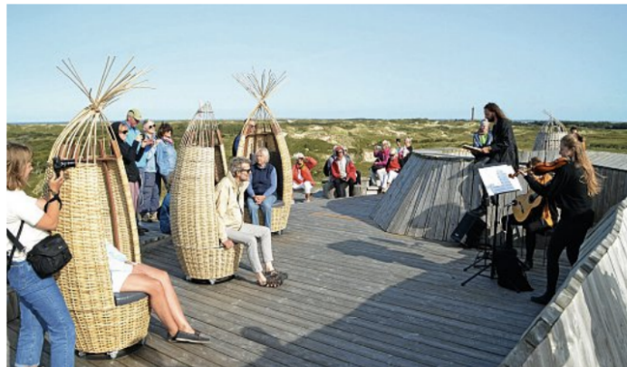
Konzertsaal besonderer Klasse: die Aussichtsplattform Dünensender.

Posth zum Auftakt der musikalischen Radtour an der Inselwindmühle „Selden Rüst“: „Ich bin heute in Doppelfunktion: Fahrradtourführer und